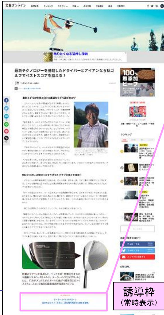
【ゴルフ特集特設ページ】