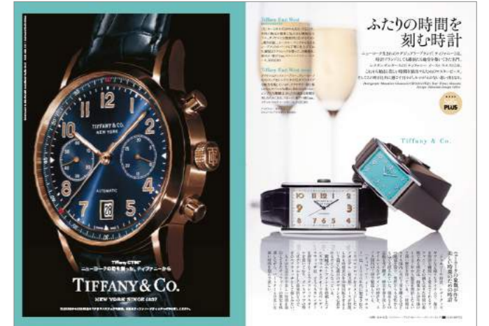
ティファニー1pTU & 1p純広