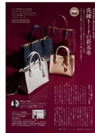
マイケル・コース1pTU