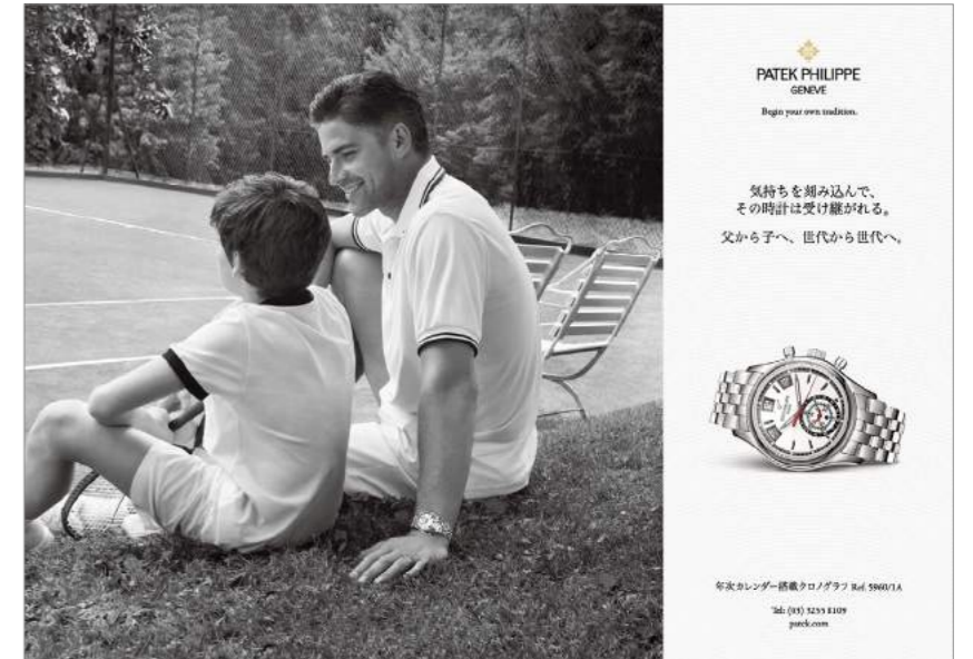
〈掲載事例〉パテック フィリップ表2純広

「週刊文春」は部数と読者の優位性だけでなく、日本で唯一「ファッションビジュアルに配慮した」総合週刊誌です。これまでも、数々のラグジュアリー&ファッションブランドからビジュアル的にも信頼いただき、純広告のみならず、クライアントの希望を的確にとらえたクリエイティブによるタイアップ広告でも、さまざまな良企画を実現してまいりました。ファッション誌では訴求に至らない、新しく良質な顧客開拓の機会としてもぜひご活用ください。