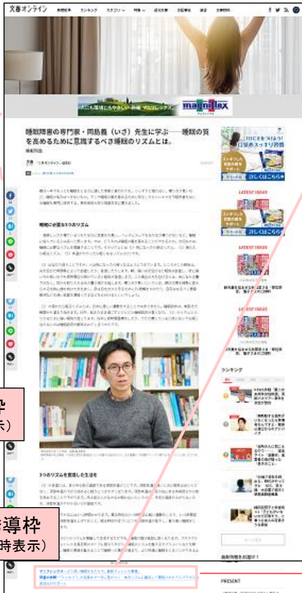
【未病特集特設ページ】

未病特集特設ページへは、全てのページの右カラムにあるSPECIAL枠と、グランドトップにローテーションで表示される記事紹介枠から誘導をはかります