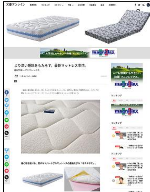
【協賛社のアイテムのご紹介】