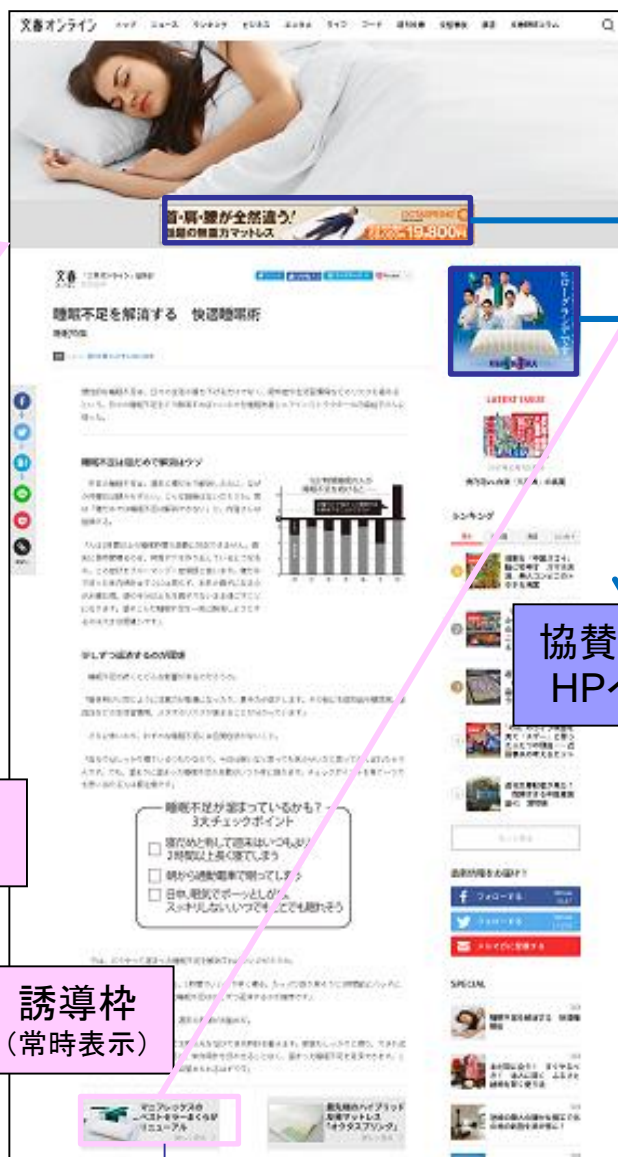
【睡眠特集特設ページ】