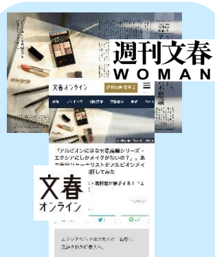
事例2)アルビオン様