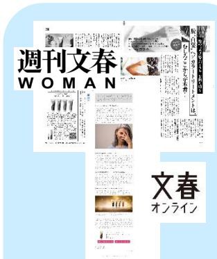
事例3)アンファアー様