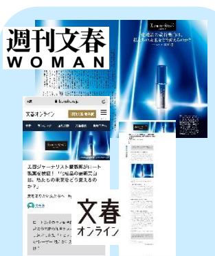
事例1)ロート製薬様