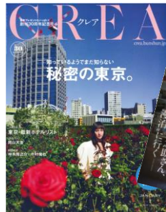
この記事さらに別冊付録として CREA12月7日発売号に挟み込みます