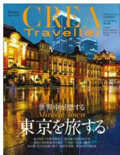
CREA Traveller 12月5日発売 本体に記事掲載

国内があらためて旅先の主役として注目される昨今、 今まで気づけなかったニッポンの魅力を再発見できる場所として、 日本全国のホテル・旅館をご紹介します。 気になる宿にゆったりと連泊しながら、地域の魅力を満喫するのが、 これからの時代の安心かつ安息を得られる、新しい贅沢旅のスタンダード。 東京・横浜・関西のラグジュアリーホテルで過ごす華麗な時間から、 優美なリゾート、風情ある旅館での癒やしのひとときまで 今こそ体感したい魅惑の休日を提案します。