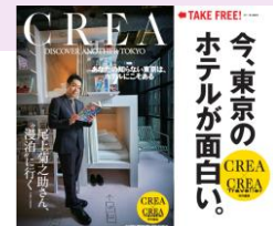
さらに加えて東京メトロ主要駅にて この別冊付録を無料配布！